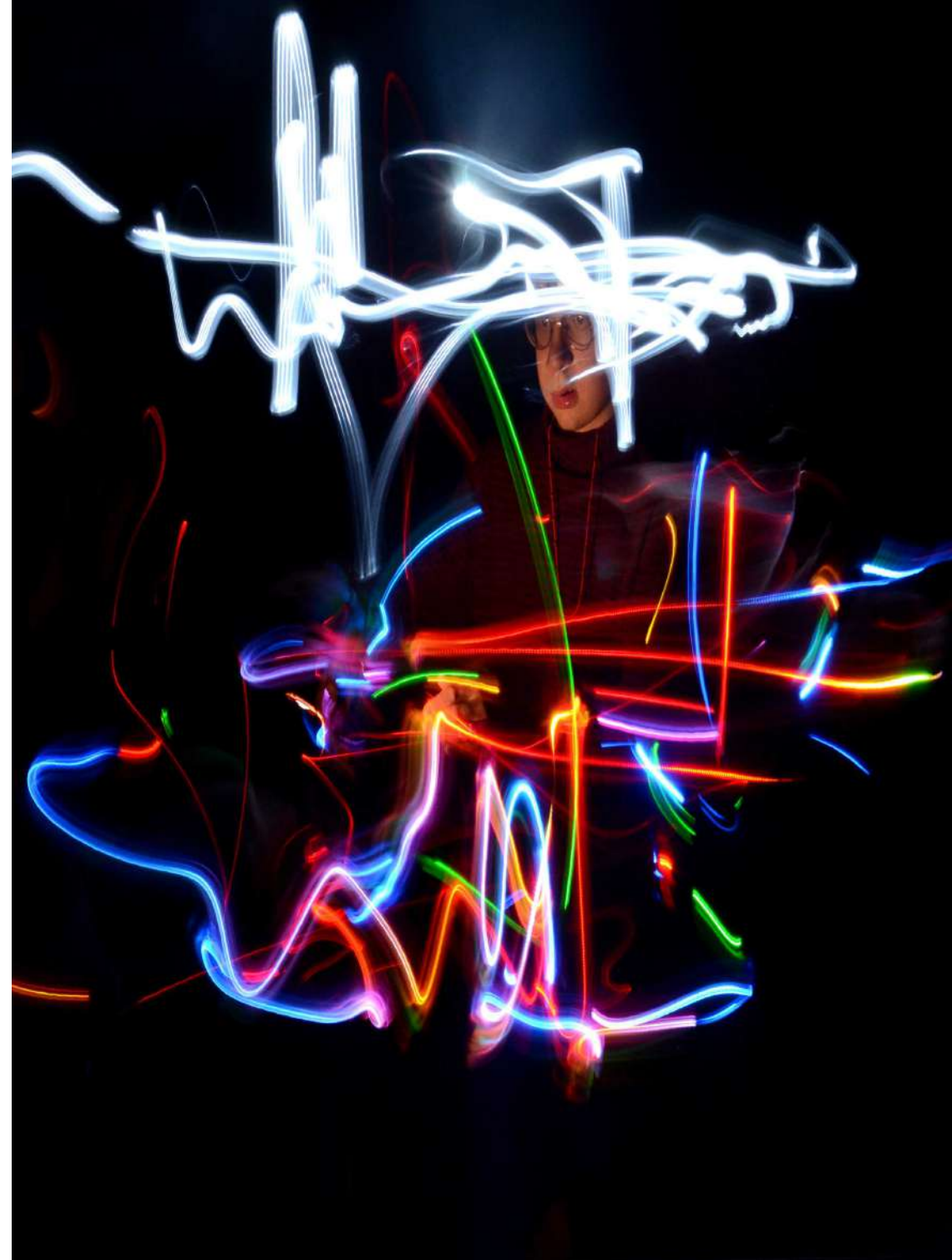
Atelier Light-Painting, Cinéma La Clef - 5° Paris, 2016

Les groupes sont constitués de 6 jeunes maximum, chacun encadré par un animateur expérimenté, et les activités sont choisies en fonction des âges et des niveaux cognitifs des enfants inscrit sur la journée.