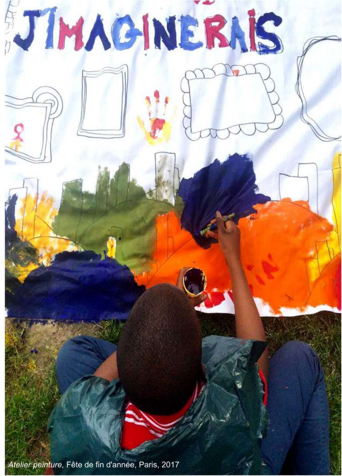
Atelier peinture, Fête de fin d'année, Paris, 2017

> Les membres de l'association participent à titre bénévole au déroulement des journées et à la gestion de l'association et adhère à hauteur de 10€ à J'imaginerais.