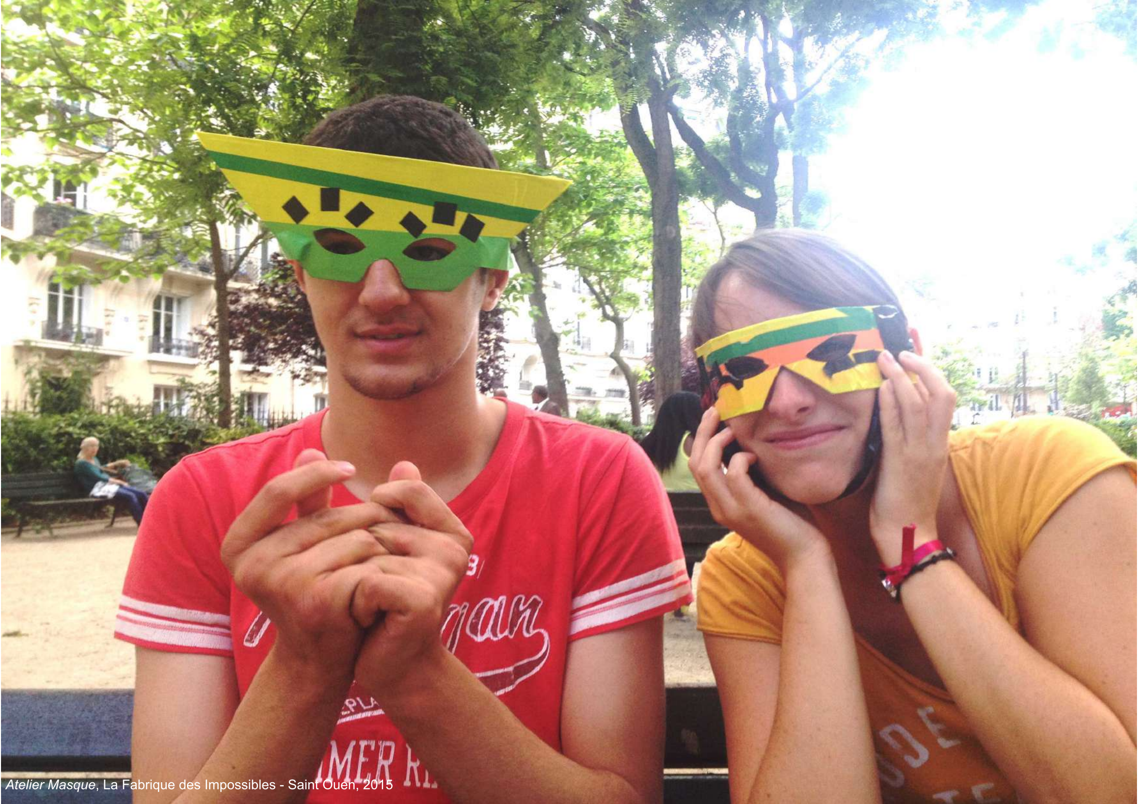
Atelier Masque, La Fabrique des Impossibles - Saint Ouen, 2015