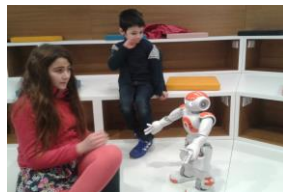
Les nouvelles technologies