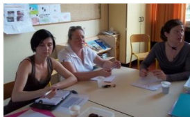
L'information et la formation