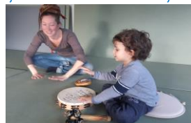
La musique, le chant, la danse