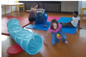
Le jeu, la socialisation, le sport